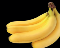
BANÁNY 756 ks