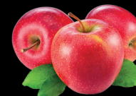
JABLKA 516 ks

Konzumace 1,5 l H 2 -vody denně je ekvivalentem dávky antioxidantů získaných konzumací několika kilogramů ovoce a zeleniny.